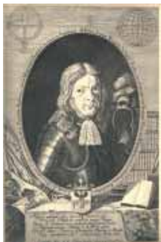
Janez Vajkard Valvasor (iz Slave vojvodine Kranjske , 1689).

terim temam se bom skoraj ali povsem izognil, ker je bilo ali pa je zdaj že zapisano drugod v tej reviji.