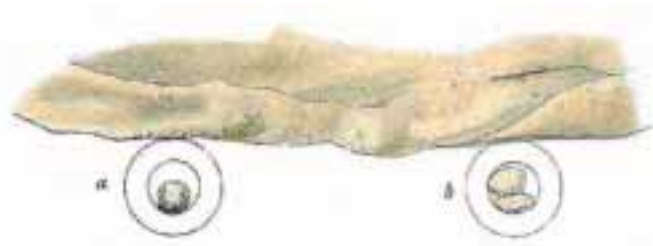
Risba jajc človeške ribice, ki jih je aprila 1882 opazovala gospodična von Chauvin (a – normalno jajce, b – dvojček; po M. von Cauvin, Die Art der Fortpflanzung des Proteus anguineus , 1883).

Cerkniško jezero), t ed prope Sittich e crypta t ubterranea , a d tivo tempore una cum aquis exit quadonque«. Torej, poleti in pri Stični. Pozneje so o tem pisali še drugi, v začetku naj bi namreč večina znanih močerilov res bila iz stiških izvirov in bruhalnikov.