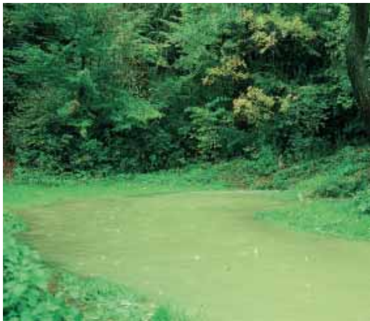
Eno od najprej znanih nahajališč človeške ribice: Vir pri Stični ob visoki vodi.